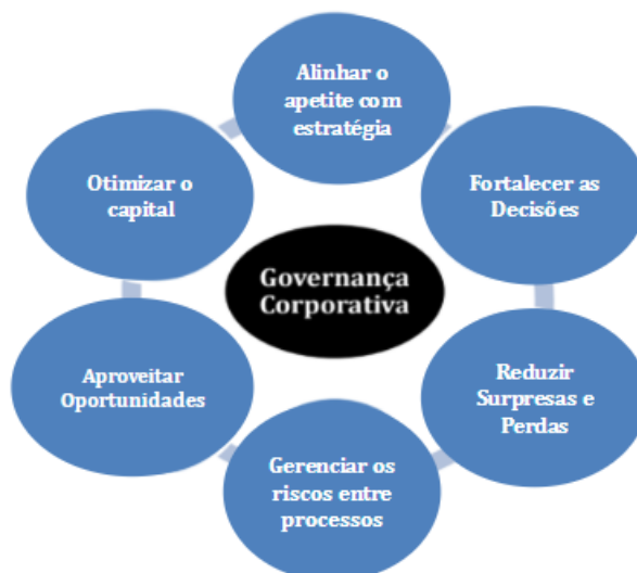
Figura 1: Objetivos da Gestão de Riscos